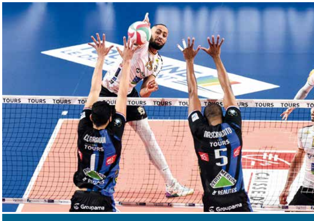
Dix médaillés olympiques seront sur les parquets de Ligue A masculine cette saison.

Nous sommes arrivés en décembre 2020 à la Ligue, et il a fallu regarder où on en était, remobiliser un peu les gens en interne, partager le projet. Les élus portent un projet, mais si les gens du quotidien ne le partagent pas, c'est compliqué. Aujourd'hui, je crois que l'on a une LNV bien focus sur ce projet d'excellence, avec des salariés qui sont totalement impliqués dans le projet. Sur les quatre, cinq premiers mois de présidence, on s'est mis en ordre de bataille pour l'année 2021-2022, qui va être à forte intensité pour nous, aussi bien sur le plan sportif que sur le