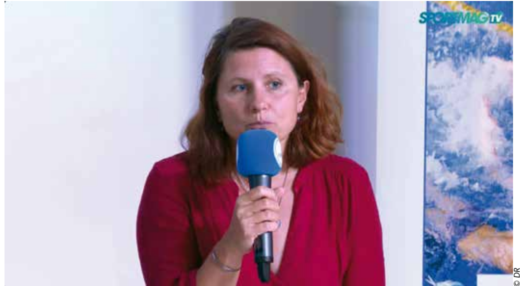
Roxana Maracineanu était présente pour l'occasion, et a rappelé l'objectif d'excellence pour Paris 2024.

Les Maisons de la Performance ont été créées pour permettre un accompagnement optimal des athlètes olympiques et paralympiques jusqu'aux Jeux. Yann Cucherat, tout nouveau conseiller Expert haute performance à l'Agence nationale du sport, dévoile les grandes lignes de ce nouveau projet bien né : « Nous souhaitons transformer le modèle sportif français avec un objectif majeur : briller aux Jeux olympiques et paralympiques de 2024 à Paris. Il se passe beaucoup de choses sur les territoires. On est parti du constat qu'il faudrait être encore meilleur