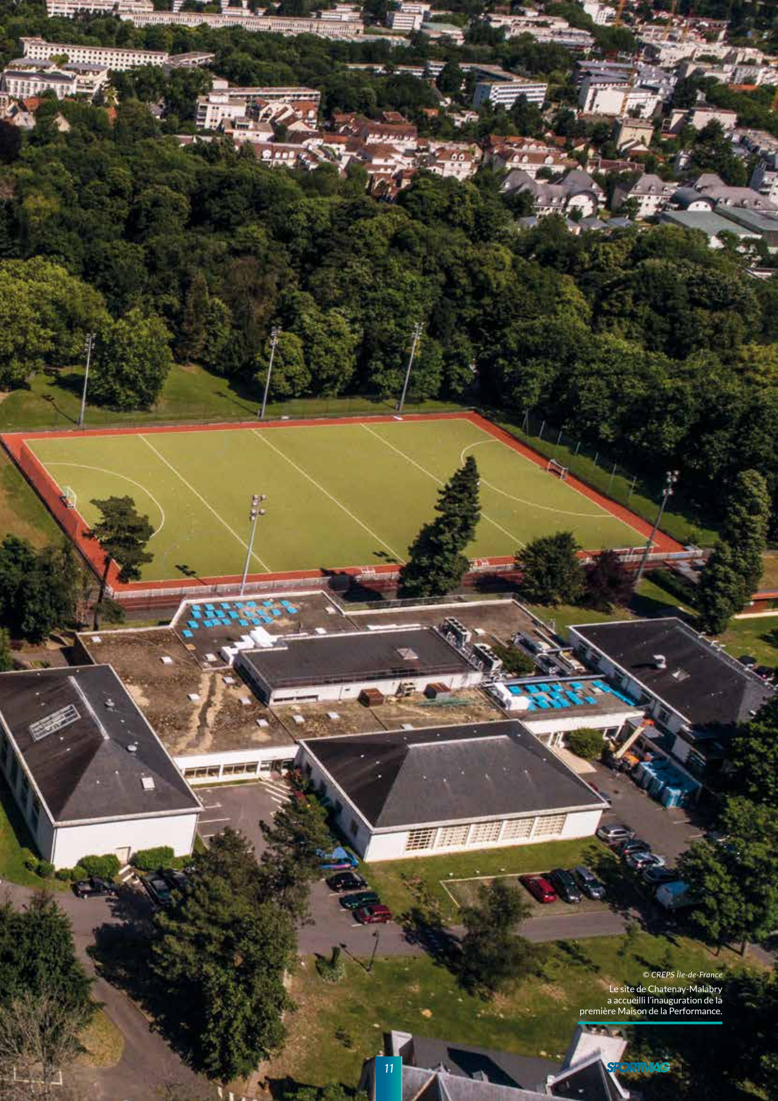
Le site de Chatenay-Malabry a accueilli l'inauguration de la première Maison de la Performance.