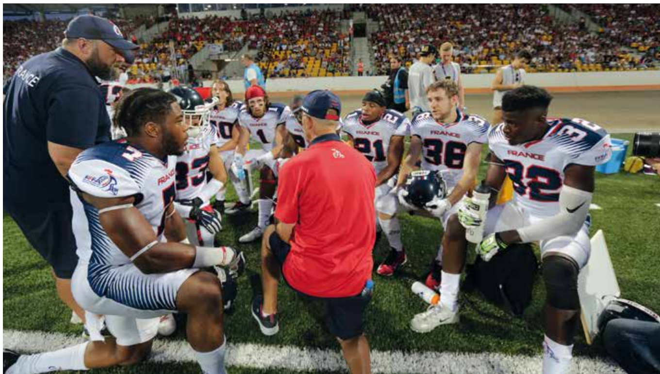
Les Bleus disputeront le match pour la médaille de bronze de la Coupe d'Europe face à la Finlande.