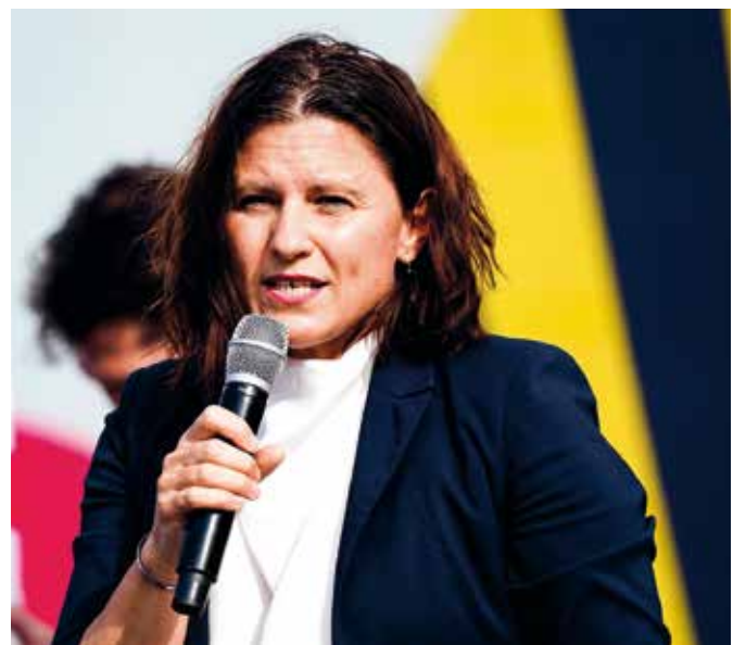
GoMyPartner collabore désormais avec le ministère des Sports.

les enseignes se battent sur les prix pour se différencier. Notre solution est un autre moyen de se différencier et c'est une véritable aubaine pour ces enseignes. Cela