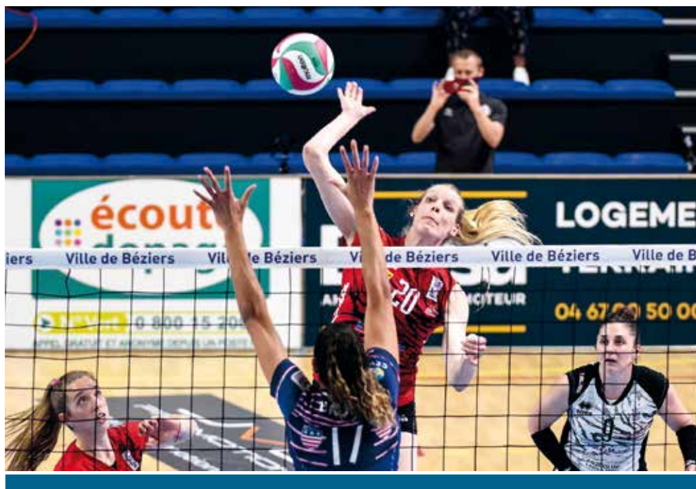
La Ligue A féminine doit se professionnaliser et franchir un nouveau cap.

Si au bout de quatre ans, un club n'a pas le nombre de points suffisants, il sera reversé dans le fédéral. Les clubs ont quatre ans, tout le monde le sait, tout le